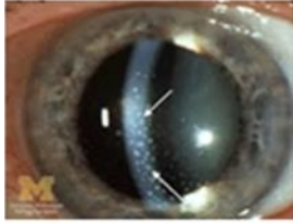
Precipitat på endotelet