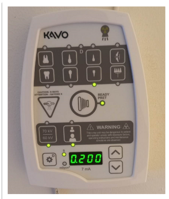
Bild 2. Exponeringstiden ska vara 0.2 s. Ställ in kV och mA som används vid vanlig bildtagning på den aktuella intraorala röntgenutrustningen. I detta fall, dvs. för Focus blir inställningarna 60 kV och 7 mA.