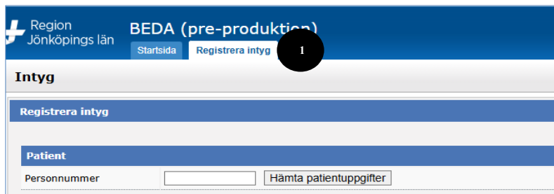
Figur 2 Fliken registrera intyg

(2) Fyll i patientens personnummer och välj hämta patientuppgifter. Patientens folkbokföringsadress visas. Om patienten bor på ett särskilt boende välj ”Hem” och i rullisten väljs aktuellt boende.