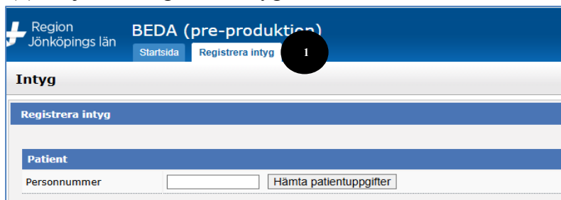
Figur 2 Fliken registrera intyg

(2) Fyll i patientens personnummer och välj hämta patientuppgifter. Patientens folkbokföringsadress visas. Om patienten bor på ett särskilt boende välj ”Särskilt boende” och i rullisten väljs aktuellt boende.